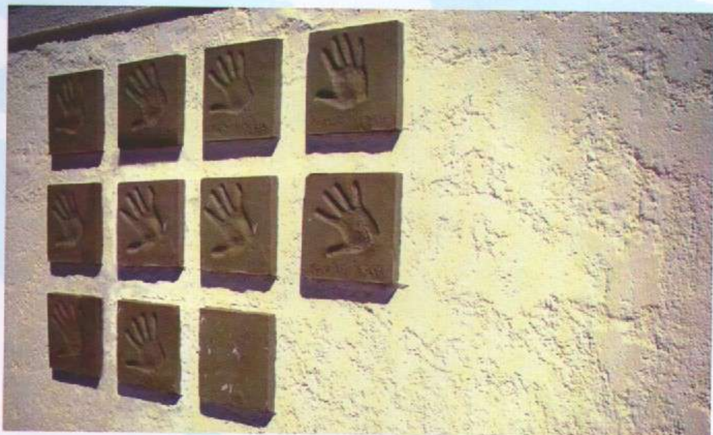
HUELLAS DE LA MEMORIA/ PRESENTES

Los huellas de las manos, ubicadas en la plazoleta, llevan los nombres de los soldados de la ciudad que estuvieron en la guerra. En una de las placas, sólo aparece el nombre del soldado ya que el mismo falleció (suicidio). Para los ex combatientes las huellas de las manos, son una manera de decir "Presentes".