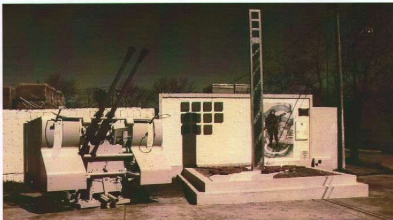
RESISTIENDO AL OLVIDO

La iniciativa de tener una plazoleta que recuerde la Guerra de Malvinas fue decisión de los veteranos de guerra. Para ello se realizaron gestiones con el gobierno municipal, quien donó el lote para la plaza y con el proyecto de construir allí el "Centro de Veteranos de Guerra".