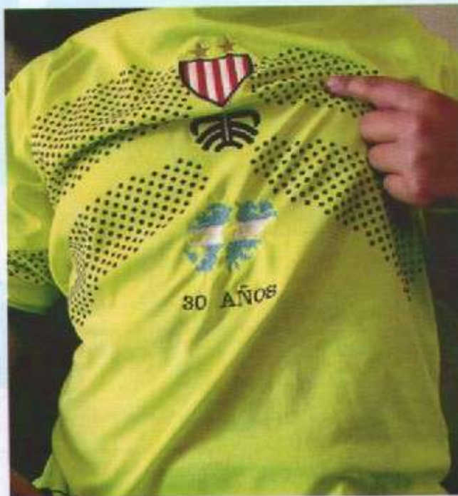
... SON NUESTRAS