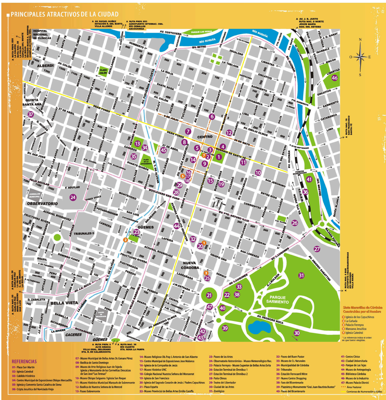
Figura 1: Mapa turístico del centro de la ciudad de Córdoba, Argentina.