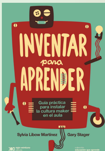
Fuente: Inventar para aprender, Martínez y Stager, Siglo Veintiuno Editores, 2019.

Asociada a la cultura libre, aparece la idea de hacer cosas por nuestra propia cuenta, de volver a instalar la curiosidad y el ingenio como organizadores/organizadoras de las prácticas escolares. Desde el Portal Educ.ar podemos acceder, de manera gratuita, al primer capítulo de un libro que nos invita a reflexionar sobre estas cuestiones y sus posibilidades de trabajo en el aula.